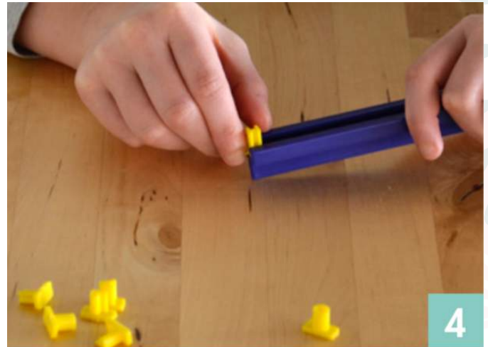
Insérez les lettres dans le support