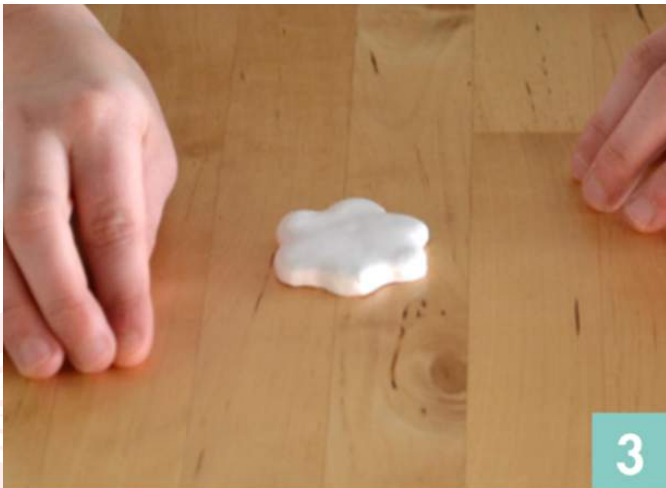
Posez la forme sur la table