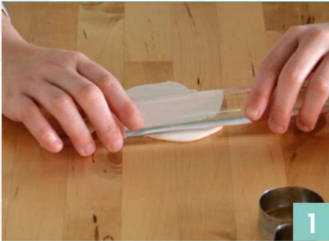
Étalez la pate du kit bijoux