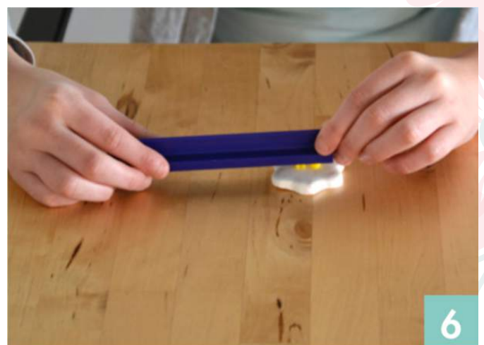
Appliquez sur la pate pour imprimer le mot