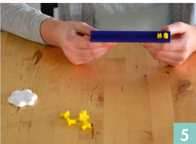
Constituez le mot souhaité